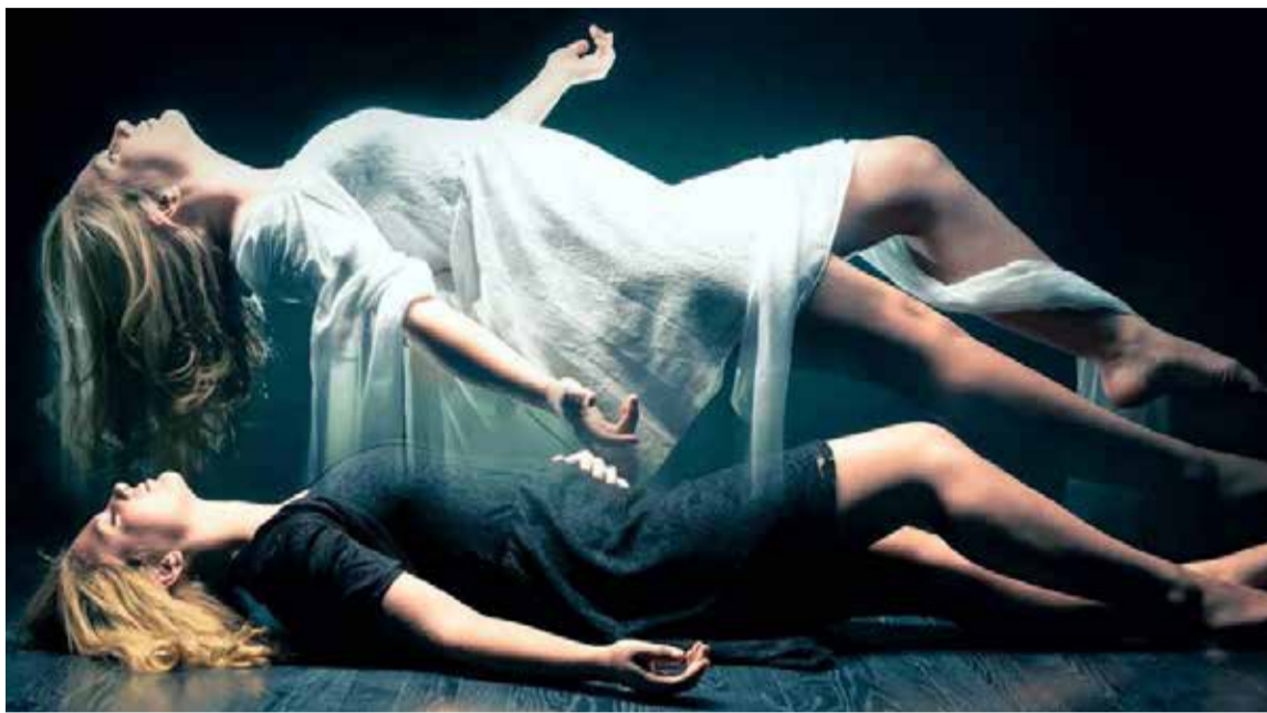
La vida después de la muerte es un tema profundamente humano que aborda cuestiones de trascendencia, identidad y propósito.

En las religiones orientales, como el hinduismo y el budismo, la vida des-