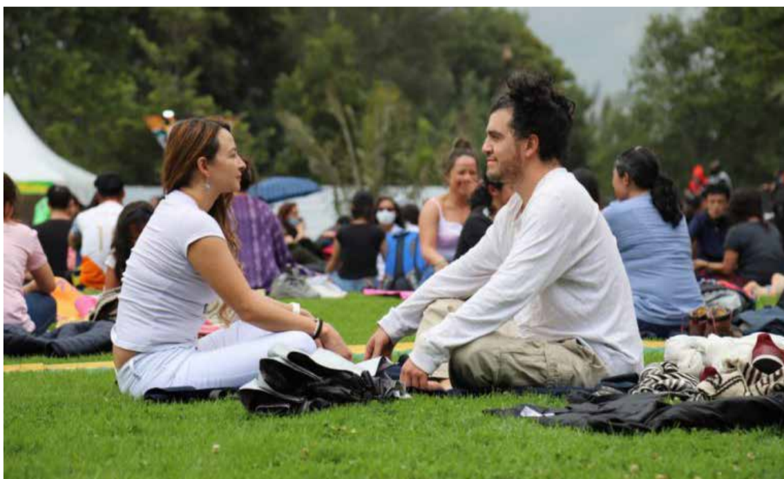
La programación del Festival Calma 2025 se extenderá por más de diez días, abarcando todas las localidades de Bogotá con actividades pensadas para todas las edades, preferencias y niveles de experiencia.

D el 14 al 23 de junio de 2025, la capital colombiana se transformará en un extenso santuario de bienestar con la llegada de la tercera edición del Festival Calma en la Ciudad: cuerpo, mente y emociones conscientes. Esta iniciativa, gratuita y abierta al público, invita a los bogotanos a experimentar la ciudad desde una perspectiva de introspección, conexión emocional y movimiento consciente, promovien-