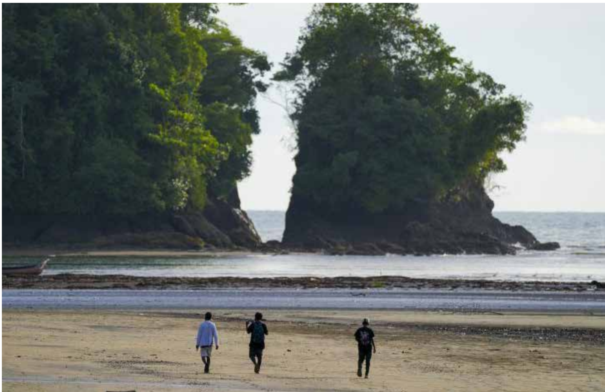
Nuquí belleza del pacífico