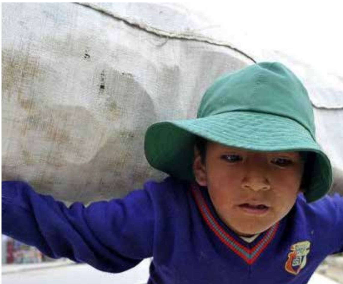
Más de 1.1 millones de niños, niñas y adolescentes realizan estas actividades por 15 horas o más a la semana

El ministro Sanguino enfatizó que, si bien la