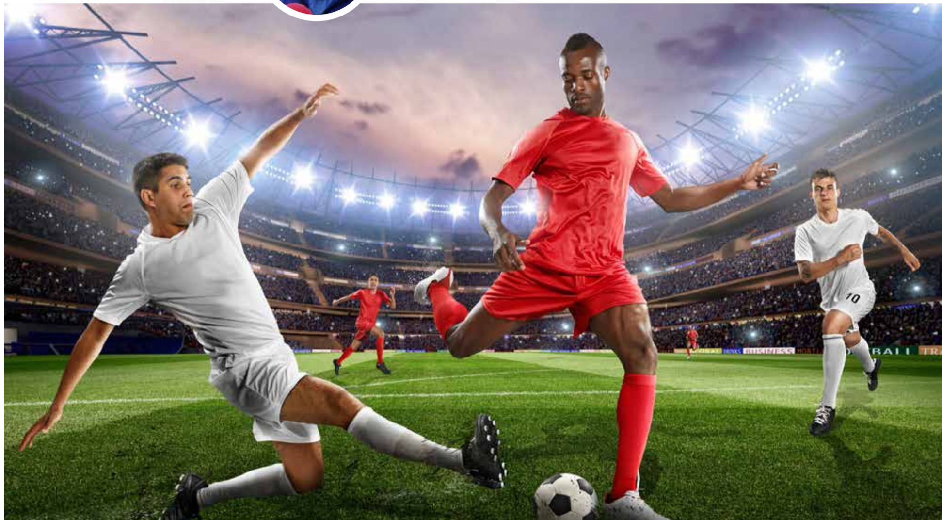
El fútbol delirante, qué anestesia. Colosos del balón que bailan en el césped verde, en un encuentro de talento, fuerza, músculo, voluntad y habilidad.

A propósito de los torrentes refrescantes de fútbol que se aprecian en estos días, en torneos internacionales. Con pasión activa en la caja de resonancia de la televisión. El de las habilidades de figuras consagradas, atajadas de porteros milagrosos y goles espectaculares que dan títulos y gloria.