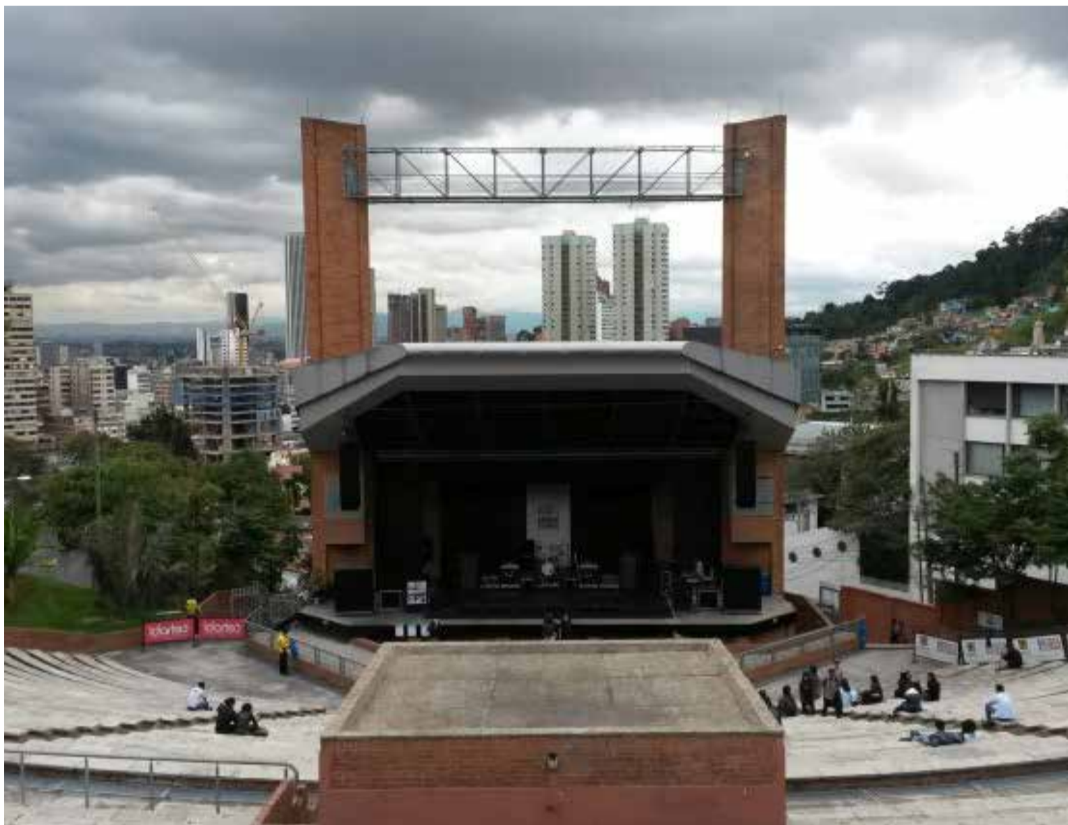
Tercera edición del Festival Calma en la Ciudad: cuerpo, mente y emociones conscientes.