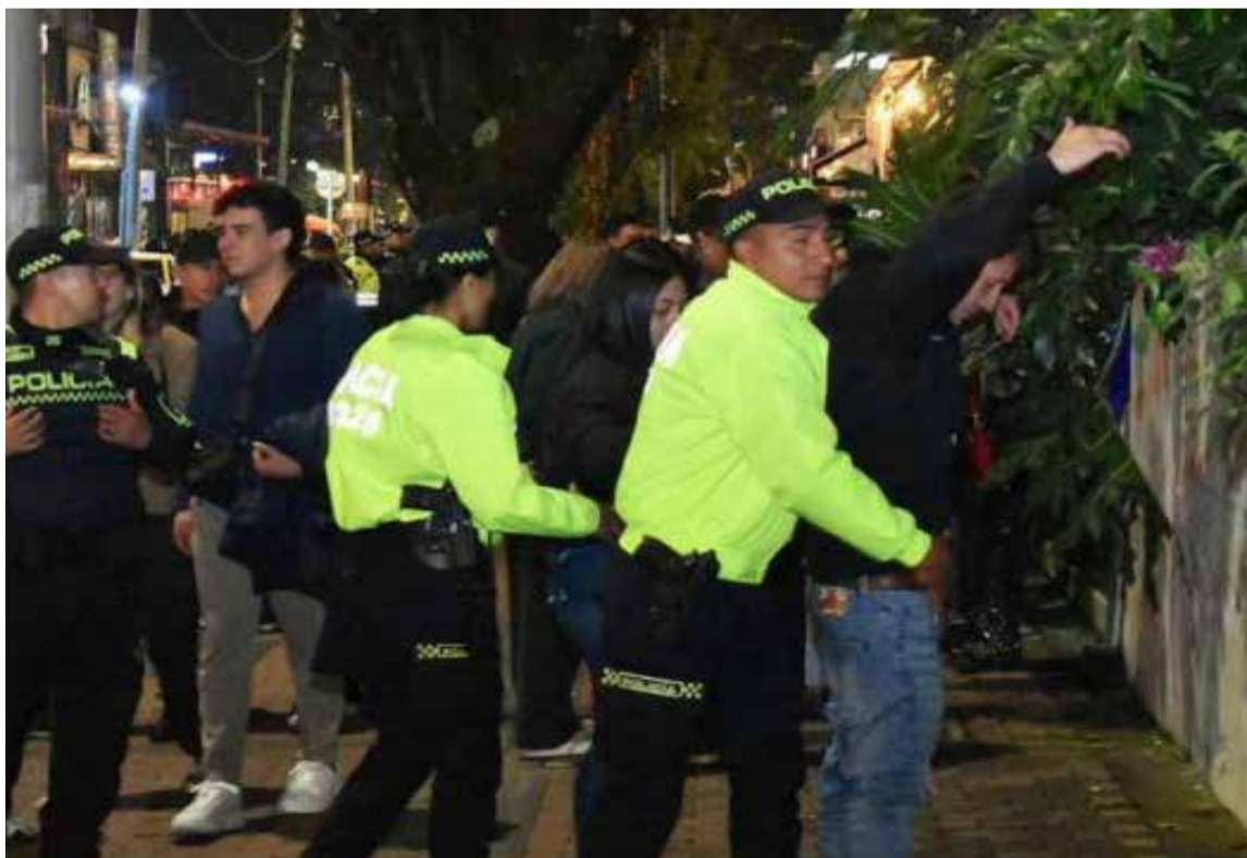
La realización de permanentes operativos en la Zona Rosa de Bogotá, ha permitido la captura de peligros delincuentes.

Estos delincuentes operaban en áreas de alta afluencia como Chapinero, el Antiguo Country y la Zona G, donde abordaban a sus víctimas en taxis. Para facilitar los robos