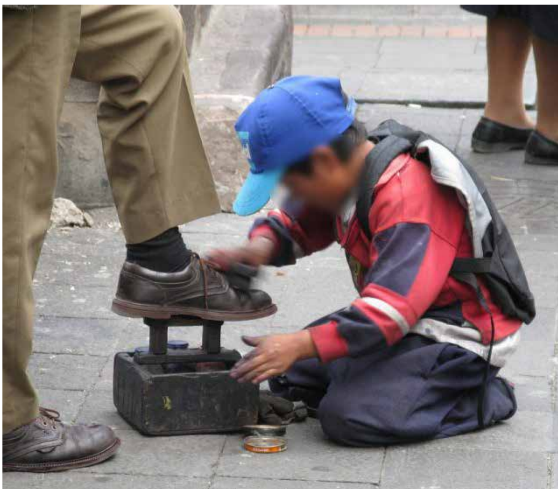
Gran Encuesta Integrada de Hogares (GEIH) del DANE, 311 mil menores entre 5 y 17 años fueron víctimas de este fenómeno en Colombia en el trimestre octubre-diciembre de 2024.

reducción de cifras es importante, «el único porcentaje moralmente admisible es cero». Esta convicción impulsa la intensificación de la articulación interinstitucional, con un enfoque étnico, territorial y diferencial. Un aspecto crítico es el trabajo doméstico y de cuidado no remunerado, labores que recaen predominantemente en mujeres y jóvenes. Más de 1.1 millones de niños, niñas y adolescentes realizan estas actividades por 15 horas o más a la semana, afectando gravemente su acceso a la educación, la salud, el juego y su desarrollo integral. En la lucha contra este flagelo, el ministro destacó varios avances. El Gobierno ratifica su compromiso con los convenios de la OIT, como el 138 sobre la edad mínima de admisión al empleo y el 182 sobre las peores formas de trabajo infantil. Se han reactivado mesas técnicas interinstitucionales en 23 departamentos, promoviendo un enfoque preventivo y de derechos, y articulando esfuerzos con entidades clave como el ICBF, la Procuraduría y la Policía de Infancia y Adolescencia. Además, se actualizó la resolución sobre trabajos peligrosos para menores de 18 años, incorporando nuevas actividades y riesgos conforme a los estándares internacionales. Finalmente, se revisó la Política Nacional para la Prevención y Erradicación del Trabajo Infantil y la Protección Integral al Adolescente Trabajador, buscando fortalecer el marco normativo y operativo en esta materia.