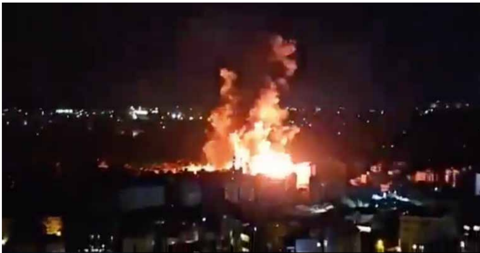
Israel ha lanzado un ataque directo contra Irán