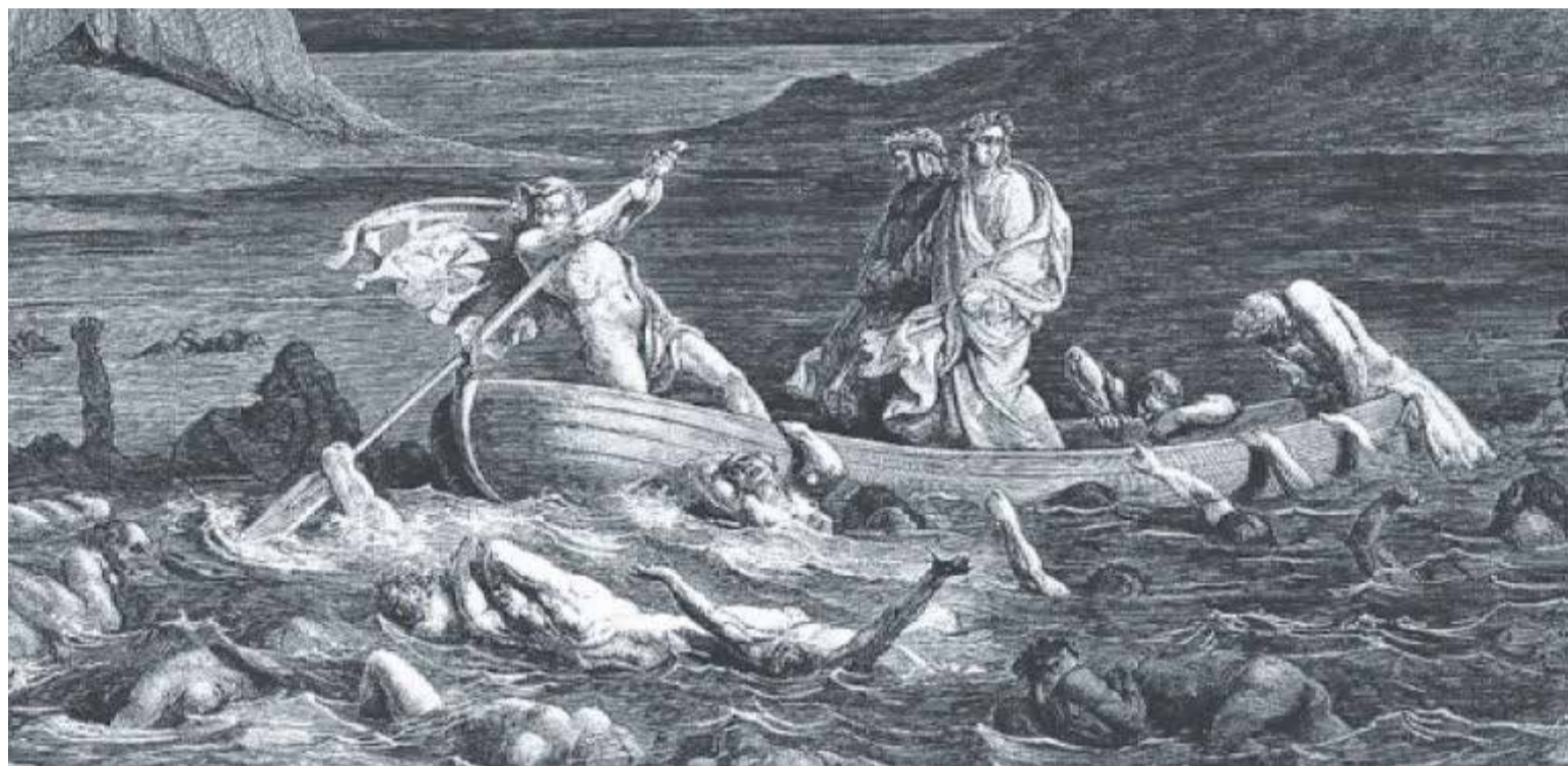
Infierno. El séptimo círculo está reservado a los violentos. El ataque al periodismo es violencia.

En estos días, las diatribas volcadas por el candidato contra colegas y medios, a los que acusó de recibir pautas oficiales o sobres bajo cuerda para beneficiar a unos o perjudicar a otros en la