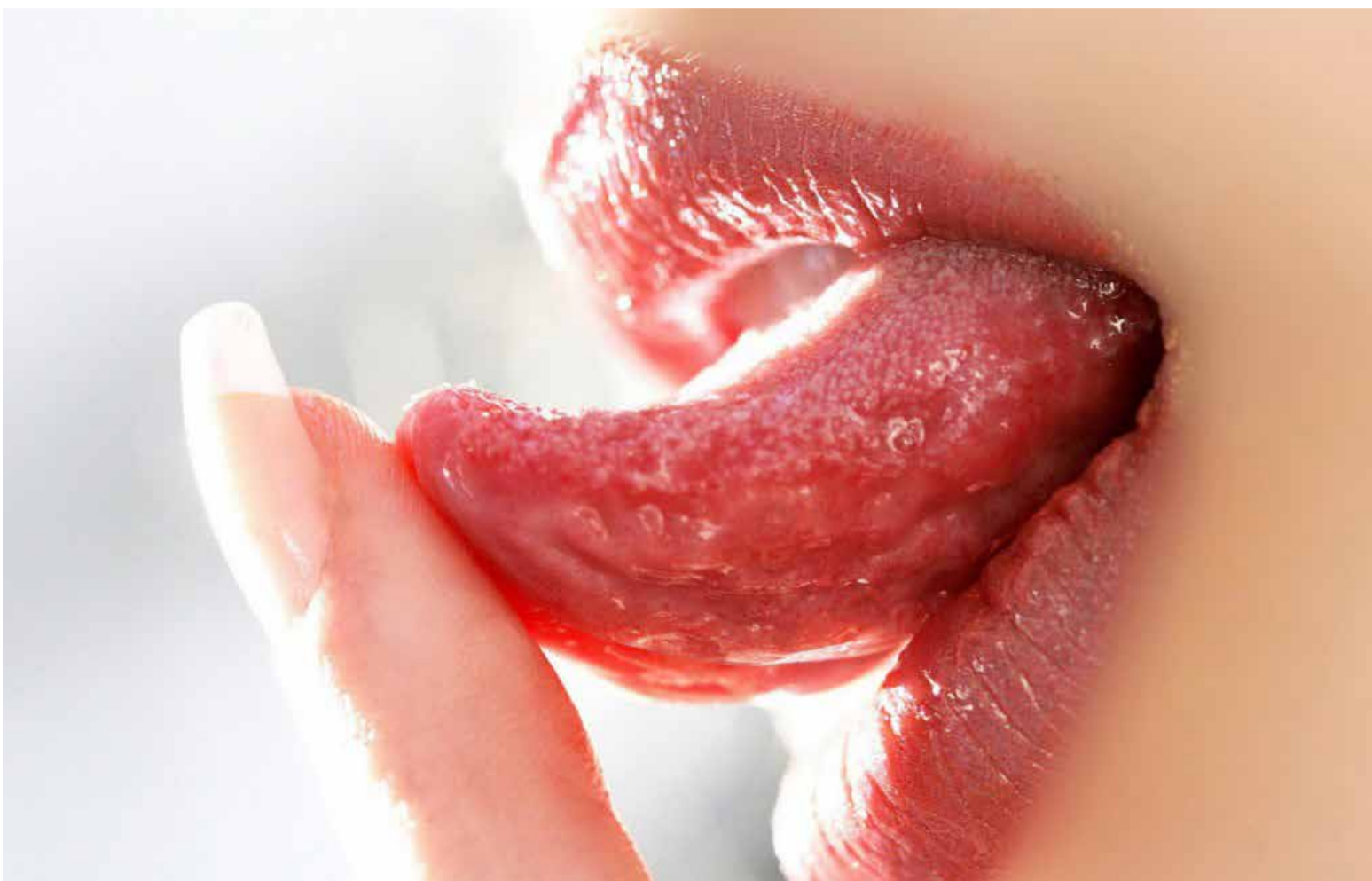
«Los lenguaraces y bocones siempre terminan afrentados por sus propias insensateces verbales».

¿Usted piensa primero lo que va a decir, o habla atropelladamente? Piense bien. Porque, eventualmente, ¡podría ser que se escuchara pronunciando su propia sentencia de desgracia personal!